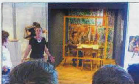
Nouvelle expo à Odyssud

dothèque de Blagnac, la Ludothèque mobile Tous en Jeu a investi le monde de l'art avec finesse et à propos pour capter le visiteur. « Nous avons voulu donner à cette exposition une dimension nouvelle en mettant l'art au service du jeu ou peut-être l'inverse. Cela nous donne l'occasion de faire découvrir au public de nouvelles sensations. Après le pari fou de faire jouer le public dans le noir, la joie de plonger dans son enfance en redécouvrant les gestes ancestraux du lancer de toupie, aujourd'hui c'est la représentation du jeu